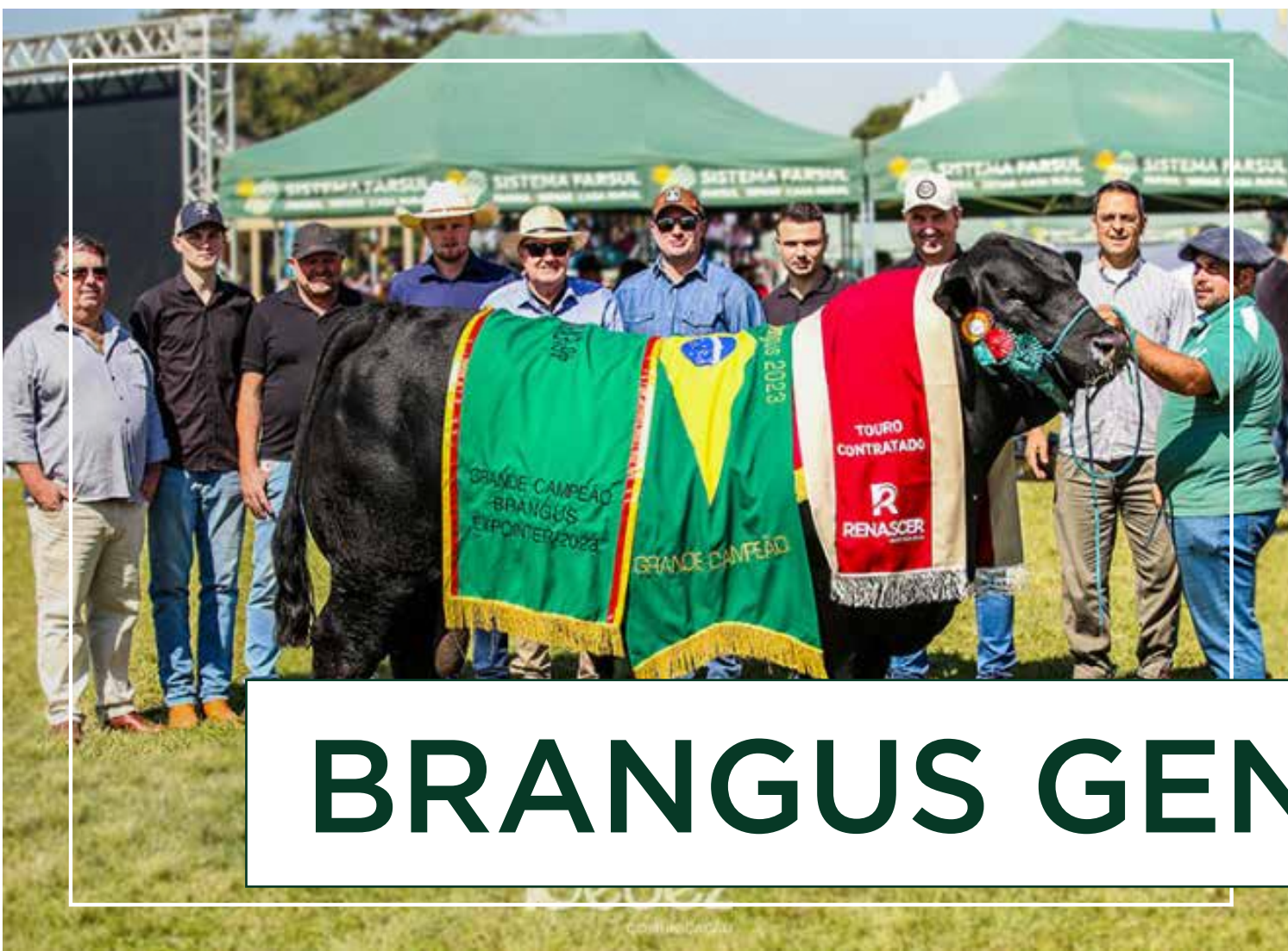
BRANGUS GENGIS KHAN