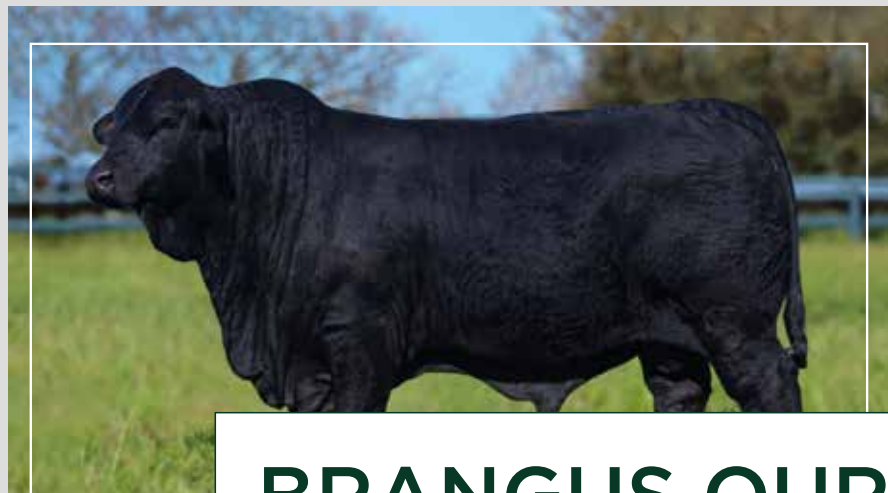
BRANGUS OURO PRETO