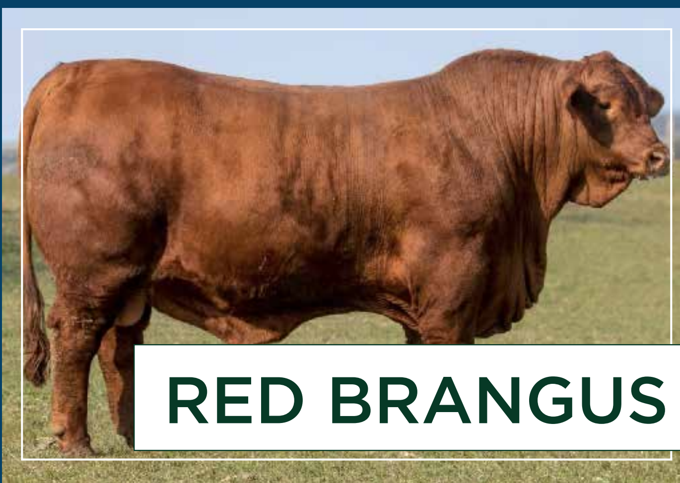
RED BRANGUS TORPEDO